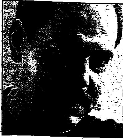
القُدس - من عبد الرؤوف ارناؤوط: